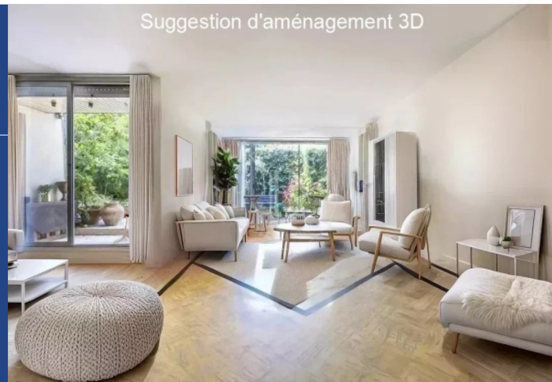
Suggestion d'aménagement 3D