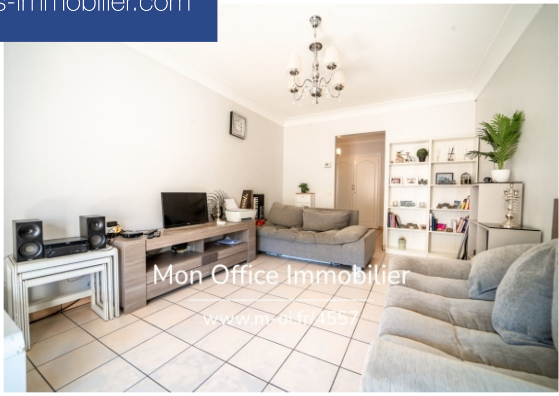
Mon Office Immobilier www.m-oi.fr/4557