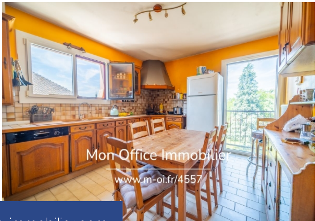
Mon Office Immobilier www.m-oi.fr/4557