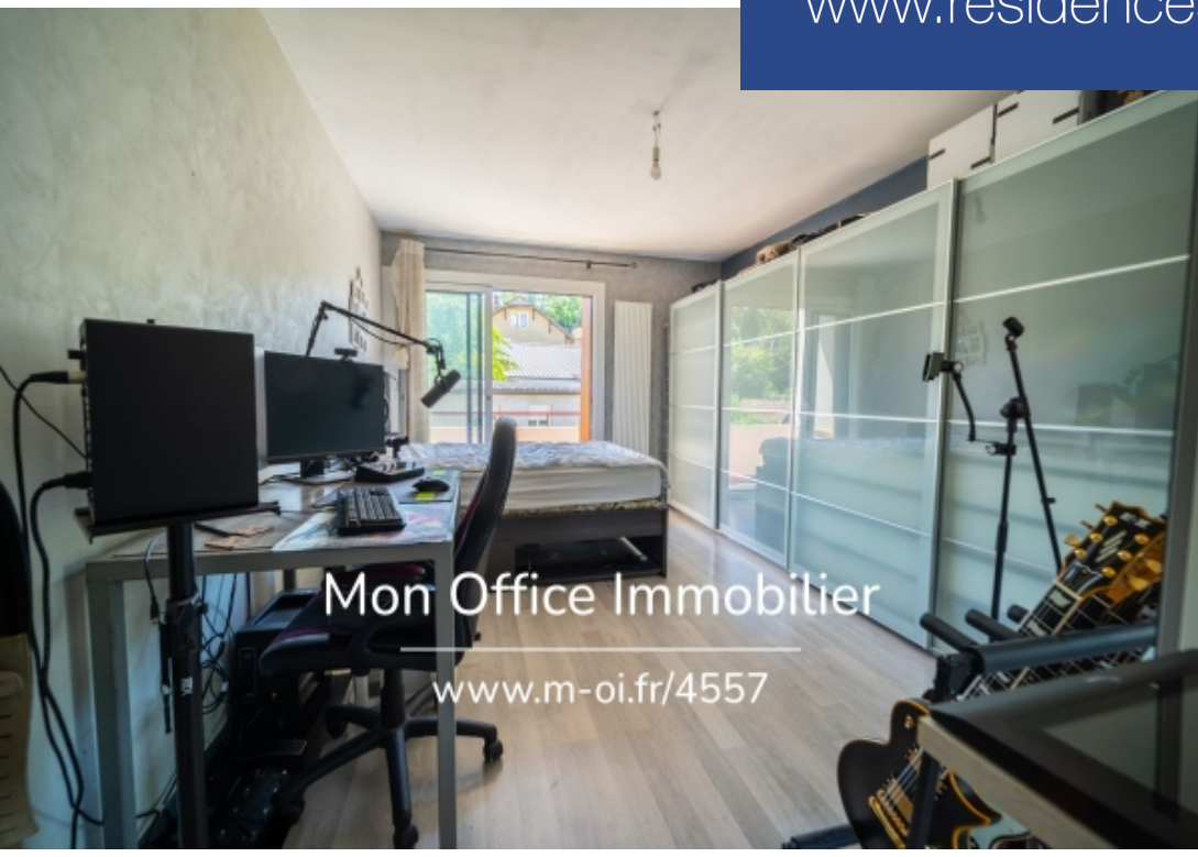
Mon Office Immobilier www.m-oi.fr/4557