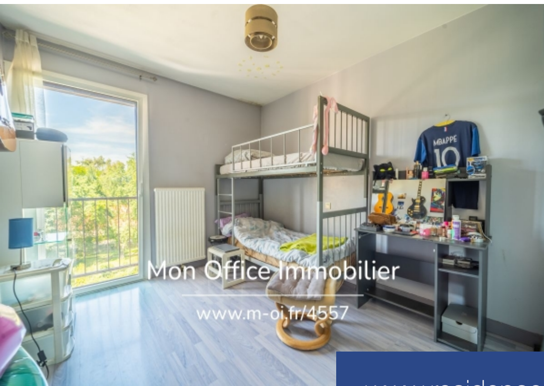
Mon Office Immobilier www.m-oi.fr/4557