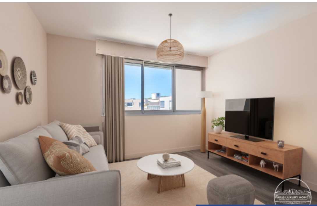
Photo non contractuelle montrant l'appartement après