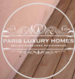
Photo non contractuelle montrant l'appartement après travaux et décoration