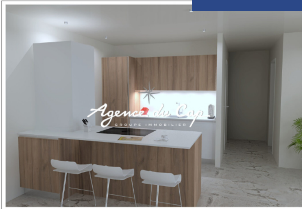
Dessin Non Contractuel