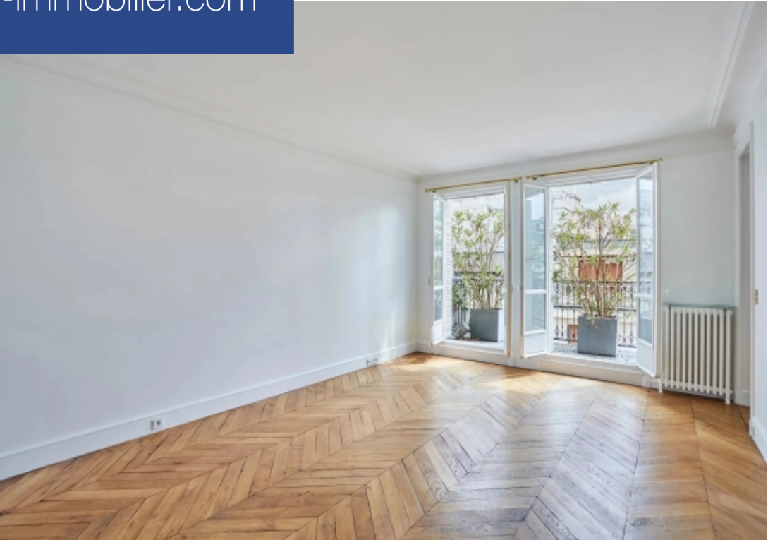
Proposition d'aménagement virtuel et non contractuelle proposée par Zstaging