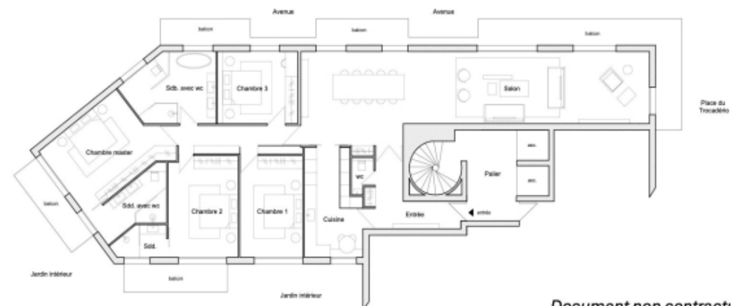
Document non contractuel