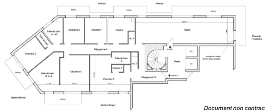
Document non contractuel