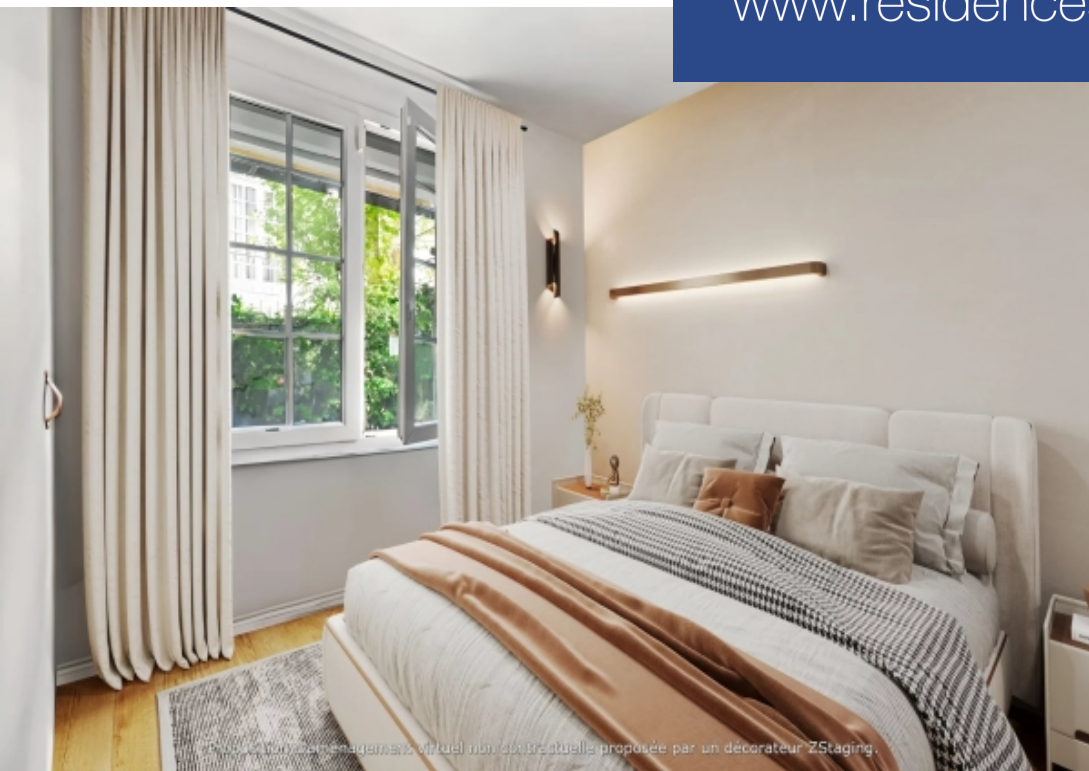
Proposition d'aménagement virtuel non contractuelle proposée par un décorateur ZStaging.