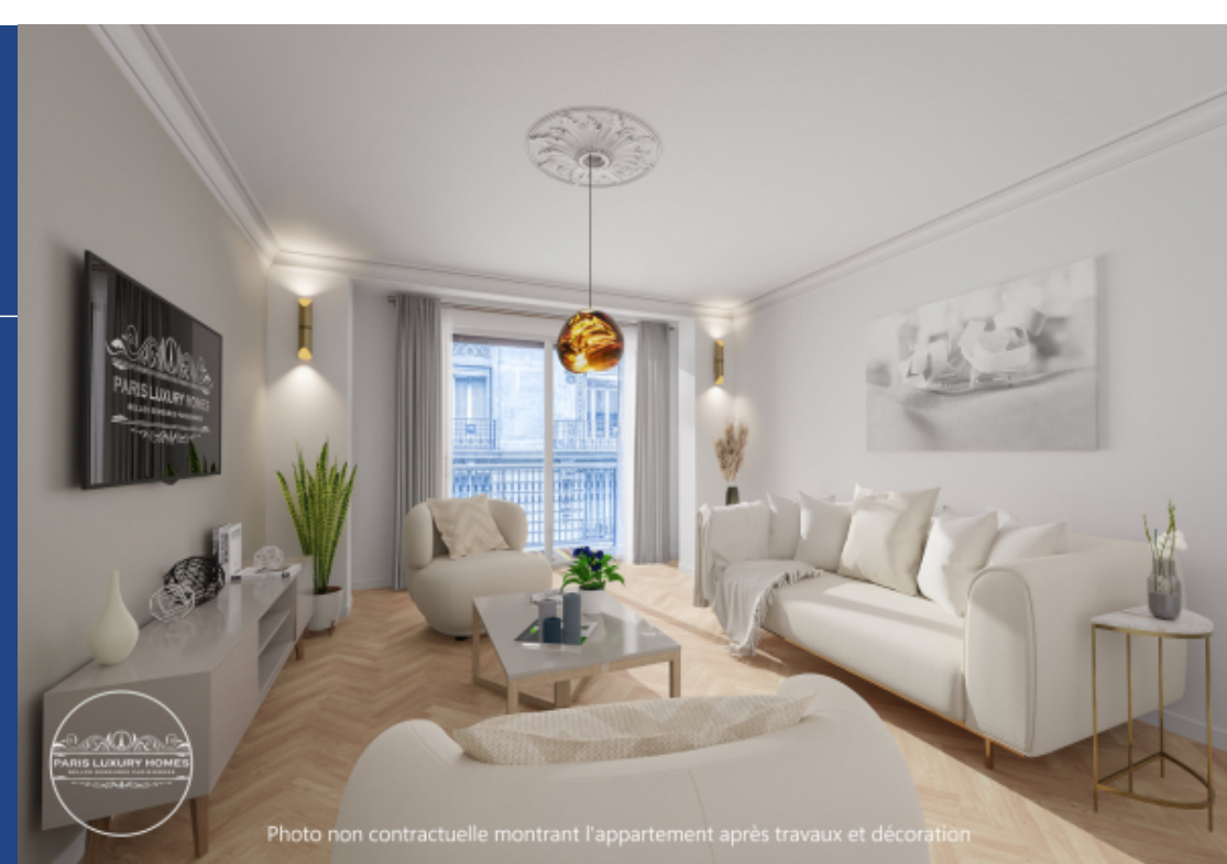
Photo non contractuelle montrant l'appartement après travaux et décoration