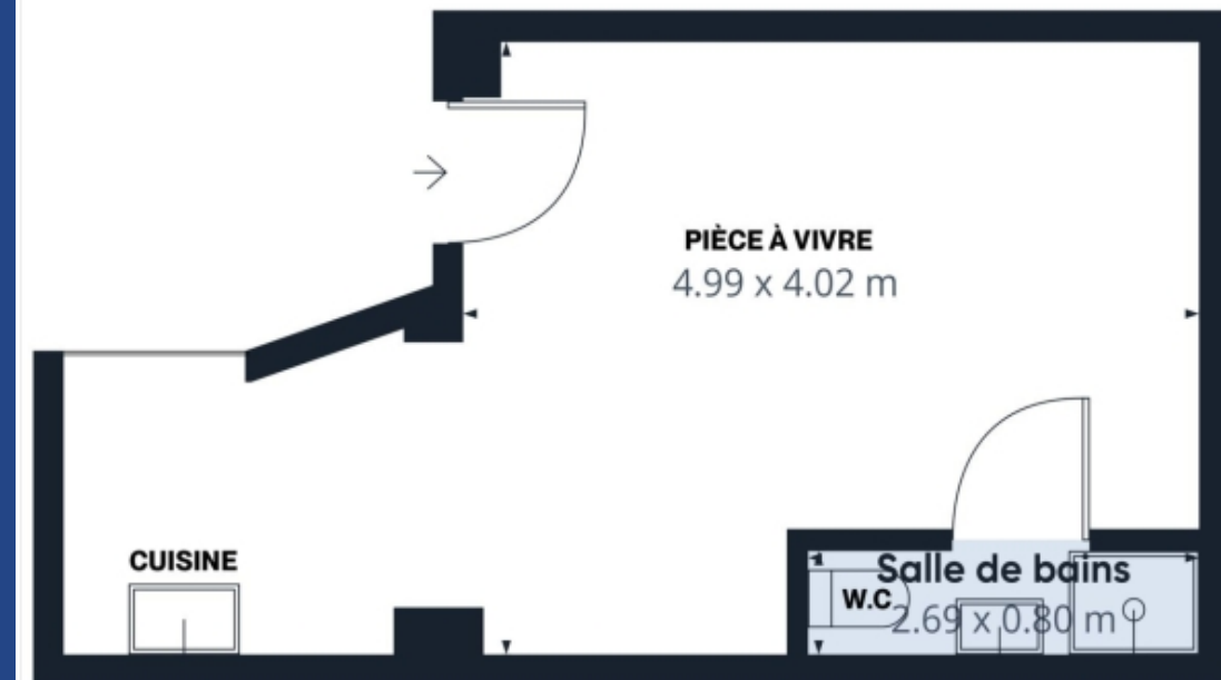
PLAN T1 SUPERFICIE - 25,85 m 2