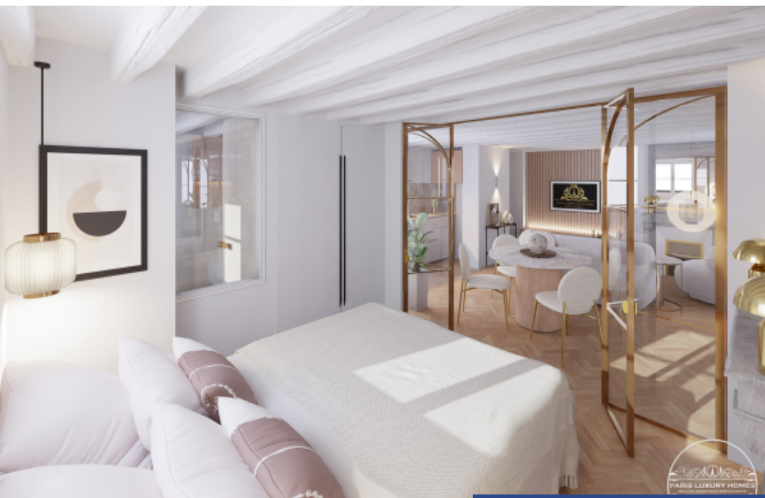
Photo non contractuelle montrant l'appartement après