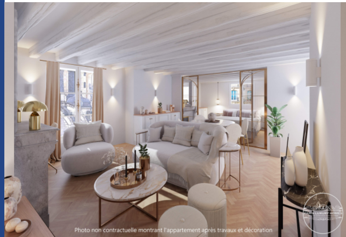
Photo non contractuelle montrant l'appartement après travaux et décoration