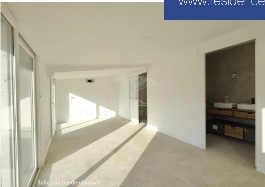
Suite 1 au rez-de-chaussée