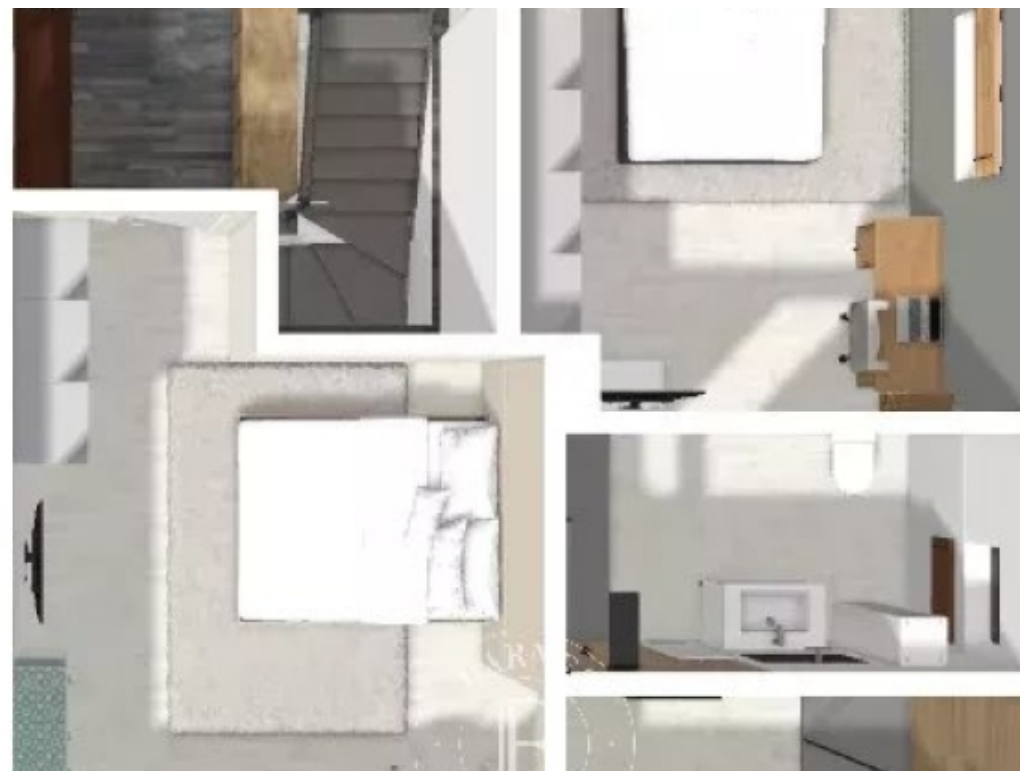
maison 1 etage