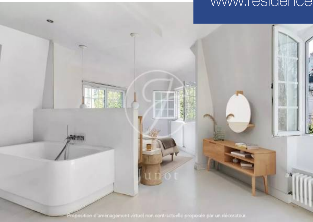
Proposition d'aménagement virtuel non contractuelle proposée par un décorateur.