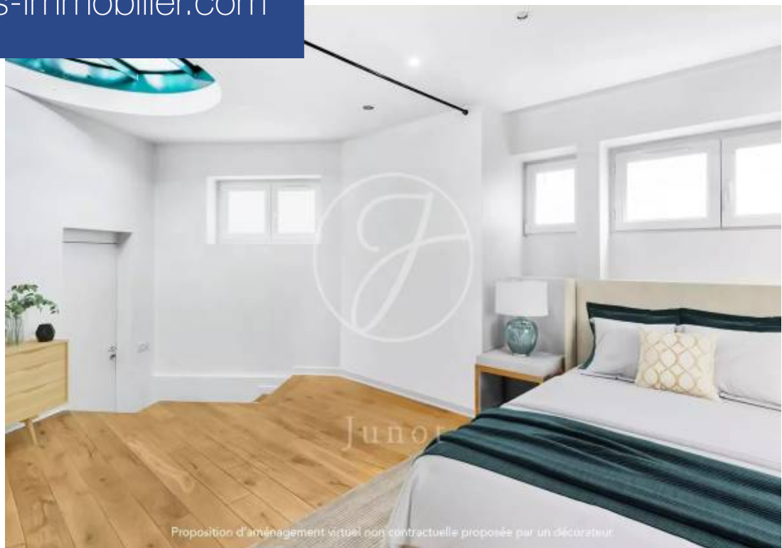
Proposition d'aménagement virtuel non contractuelle proposée par un décorateur.