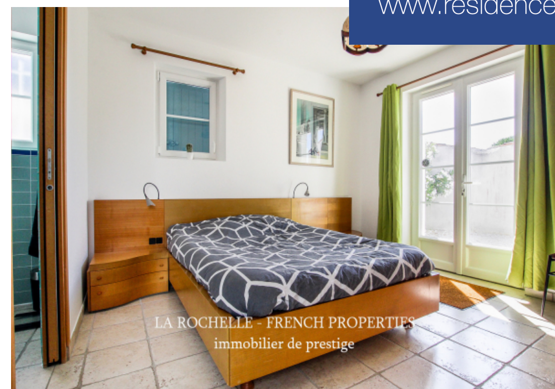
LA ROCHELLE - FRENCH PROPERTIES immobilier de prestige