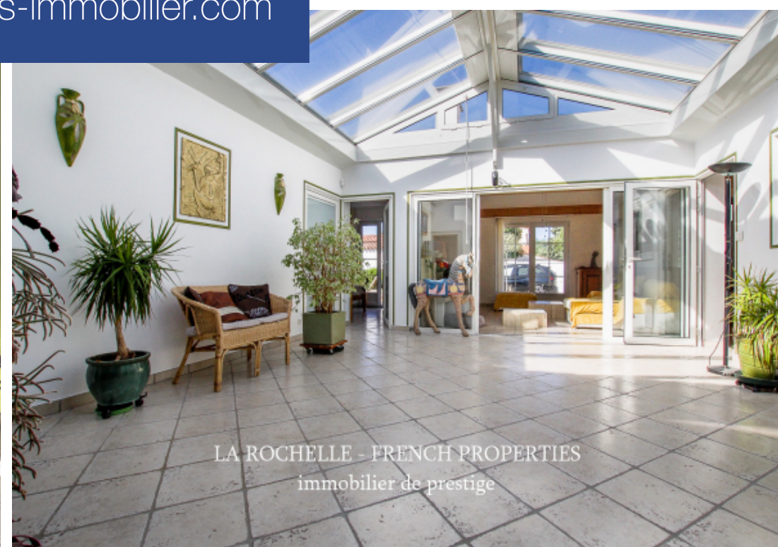
LA ROCHELLE - FRENCH PROPERTIES immobilier de prestige