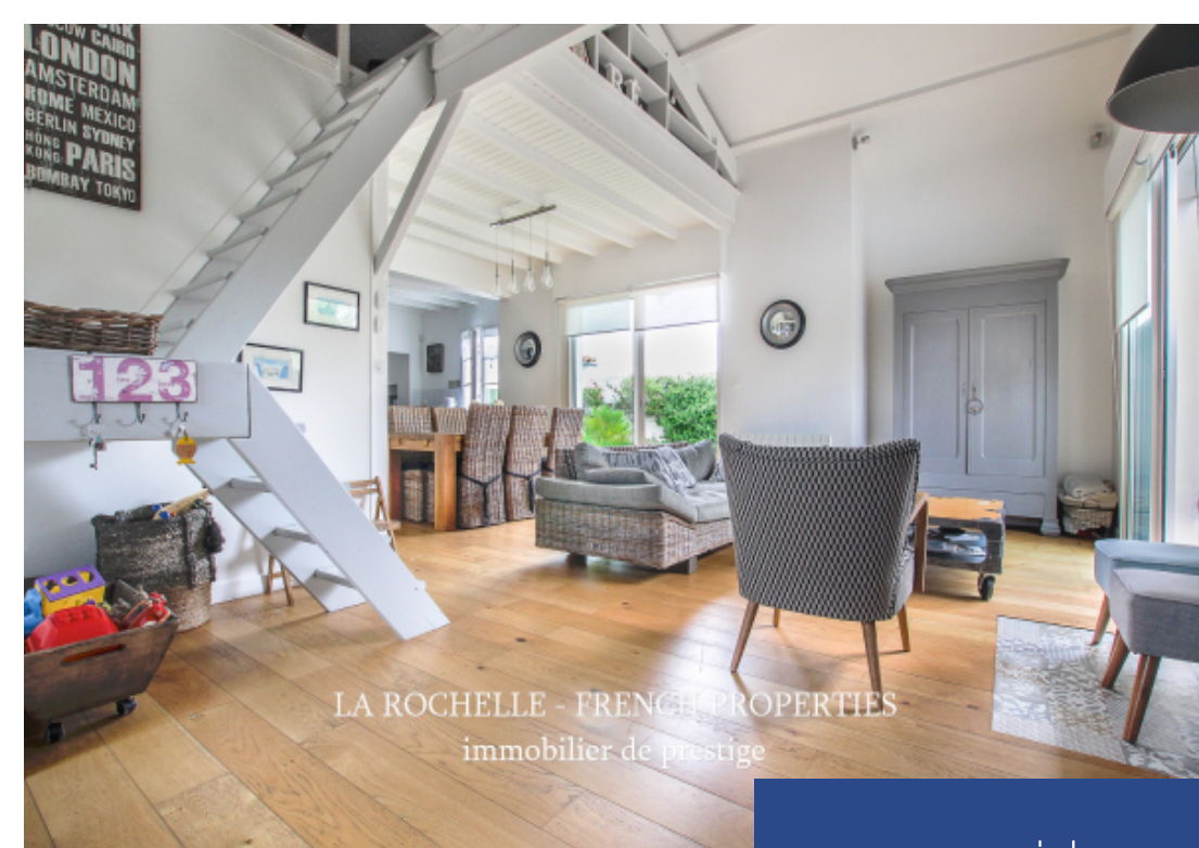
LA ROCHELLE - FRENCH PROPERTIES immobilier de prestige