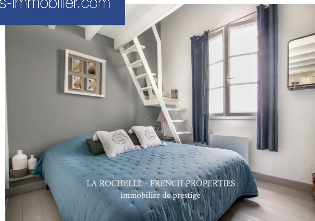
LA ROCHELLE - FRENCH PROPERTIES immobilier de prestige