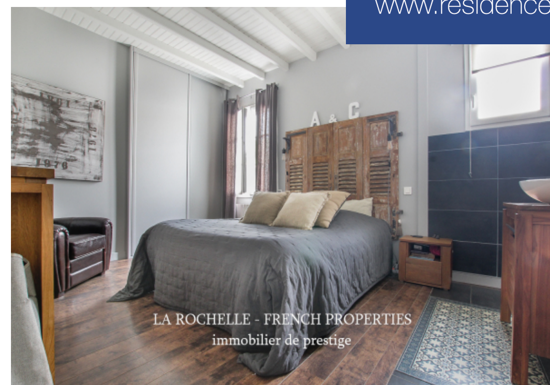
LA ROCHELLE - FRENCH PROPERTIES immobilier de prestige